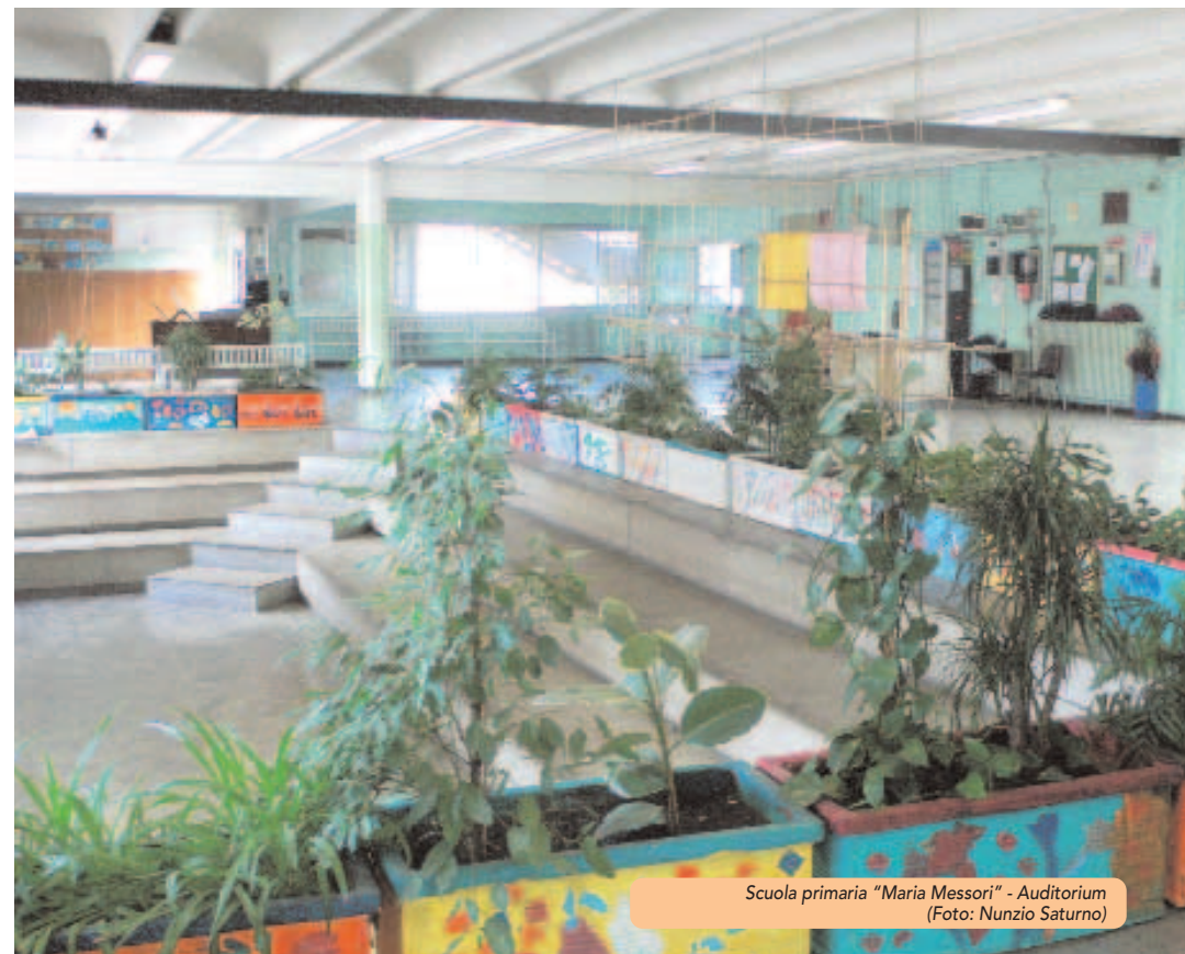
Scuola primaria "Maria Messori" - Auditorium

Palestra Scuola di Via Como Via Como Si svolgono allenamenti e tornei di Basket, Volley, Arti Marziali; corsi di ginnastica per adulti, aerobica, danza sportiva.