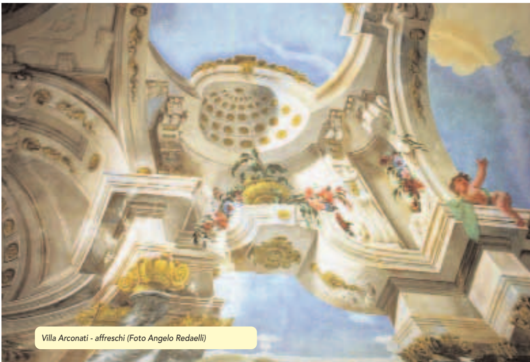
Villa Arconati - affreschi