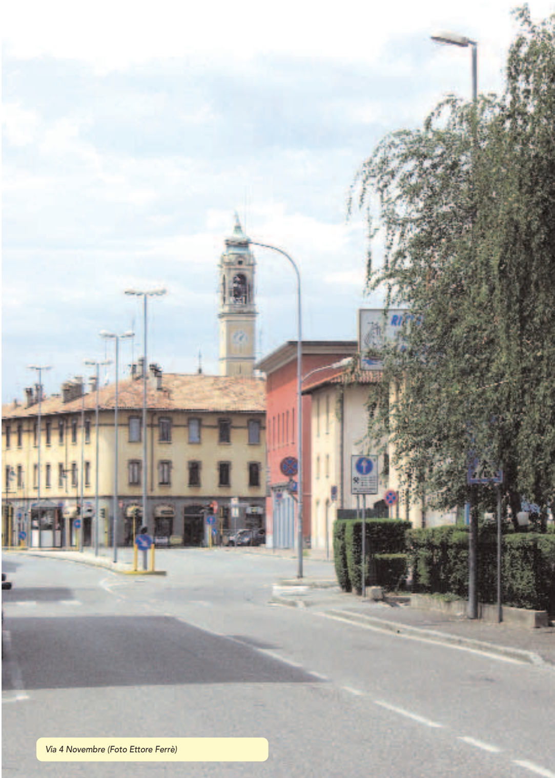
Via 4 Novembre