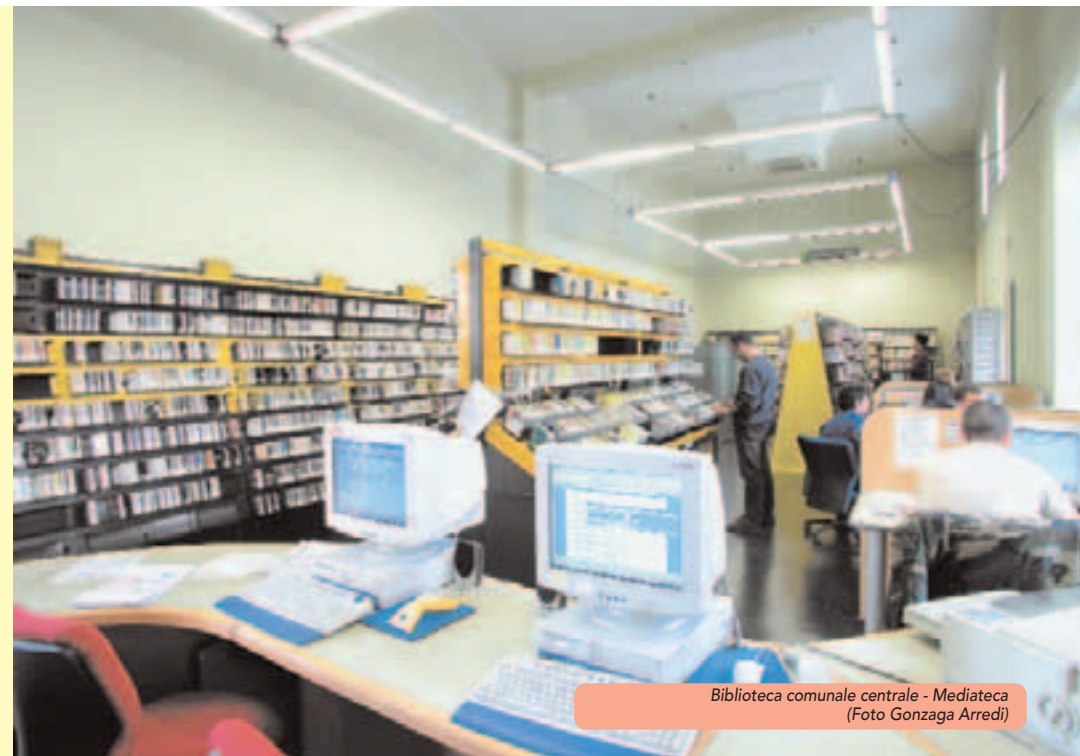
Biblioteca comunale centrale - Mediateca

Dott. Rolando Ravani Studio medico dentistico Via G. Verdi, 58 .....Tel. 023502907 20021 Bollate MI