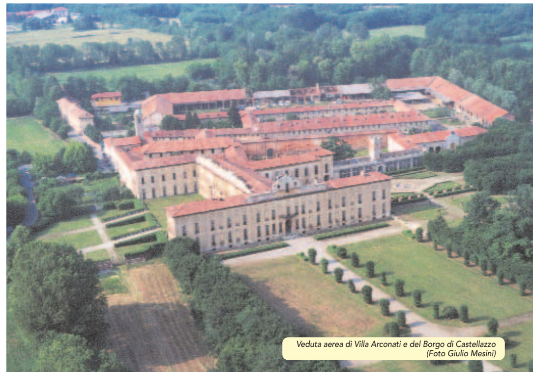
Veduta aerea di Villa Arconati e del Borgo di Castellazzo

Following the town's transformation from a predominantly rural society to an industrialized twentieth-century city, Bollate is currently undergoing further changes to accommodate the postindustrial generation.