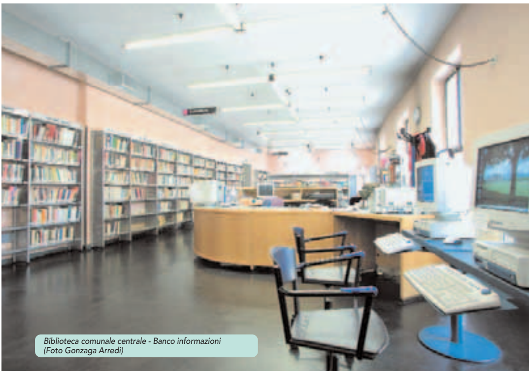
Biblioteca comunale centrale - Banco informazioni