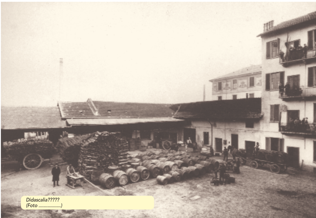
Didascalia????? (Foto .....)