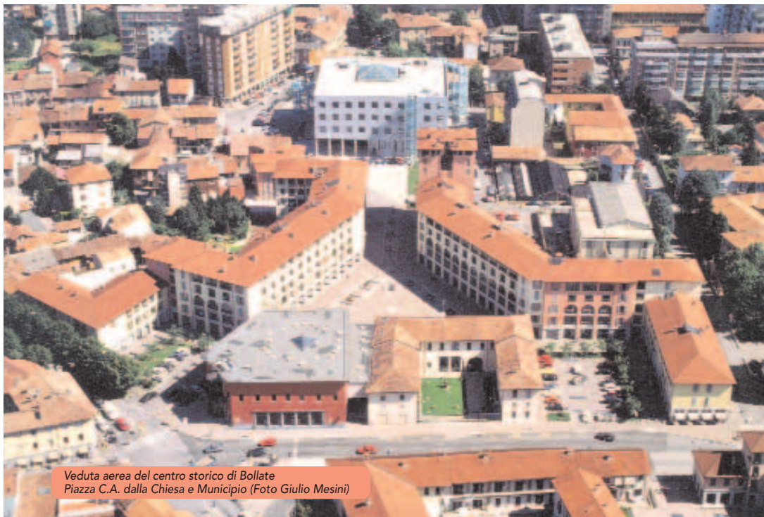
Veduta aerea del centro storico di Bollate Piazza C.A. dalla Chiesa e Municipio