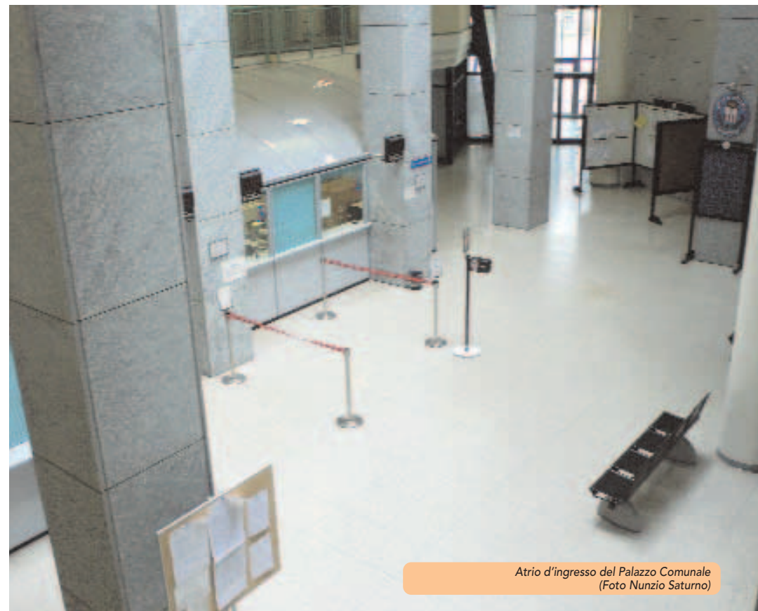
Atrio d'ingresso del Palazzo Comunale

Ufficio Servizi Sociali .....Tel. 02 35005568