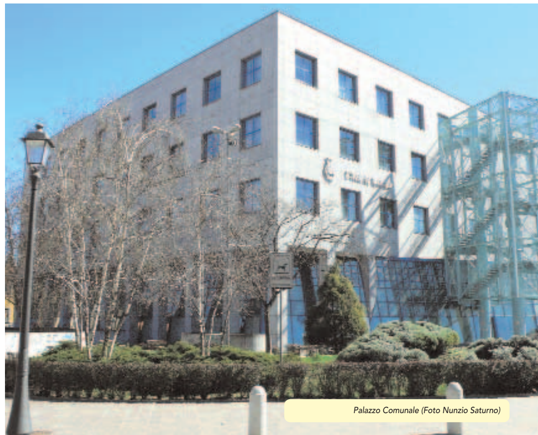
Palazzo Comunale

150 gr. di farina gialla a grana grande; 150 gr. di farina gialla a grana fine; 150 gr. di farina bianca; 150 gr. di burro; 100 gr. di zucchero; 200 gr. di panna liquida; 15 gr. di lievito di birra; 1 bicchiere di latte; 3 uova; zucchero vanigliato; 1 cucchiaino di fiori di sambuco; sale.