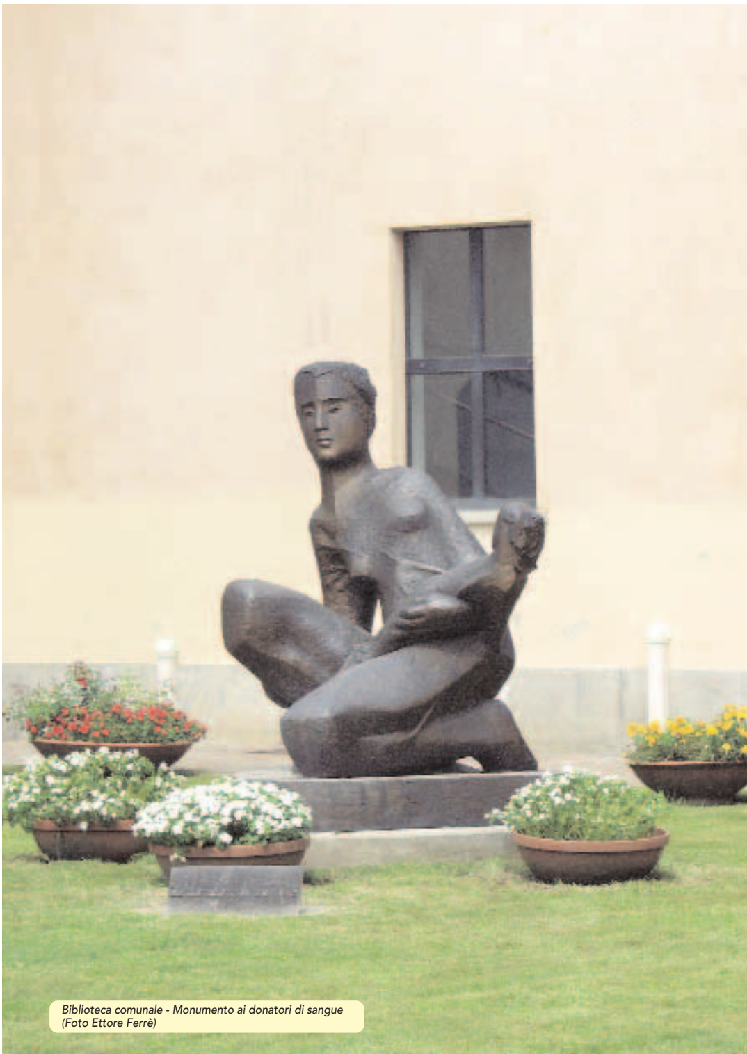
Biblioteca comunale - Monumento ai donatori di sangue