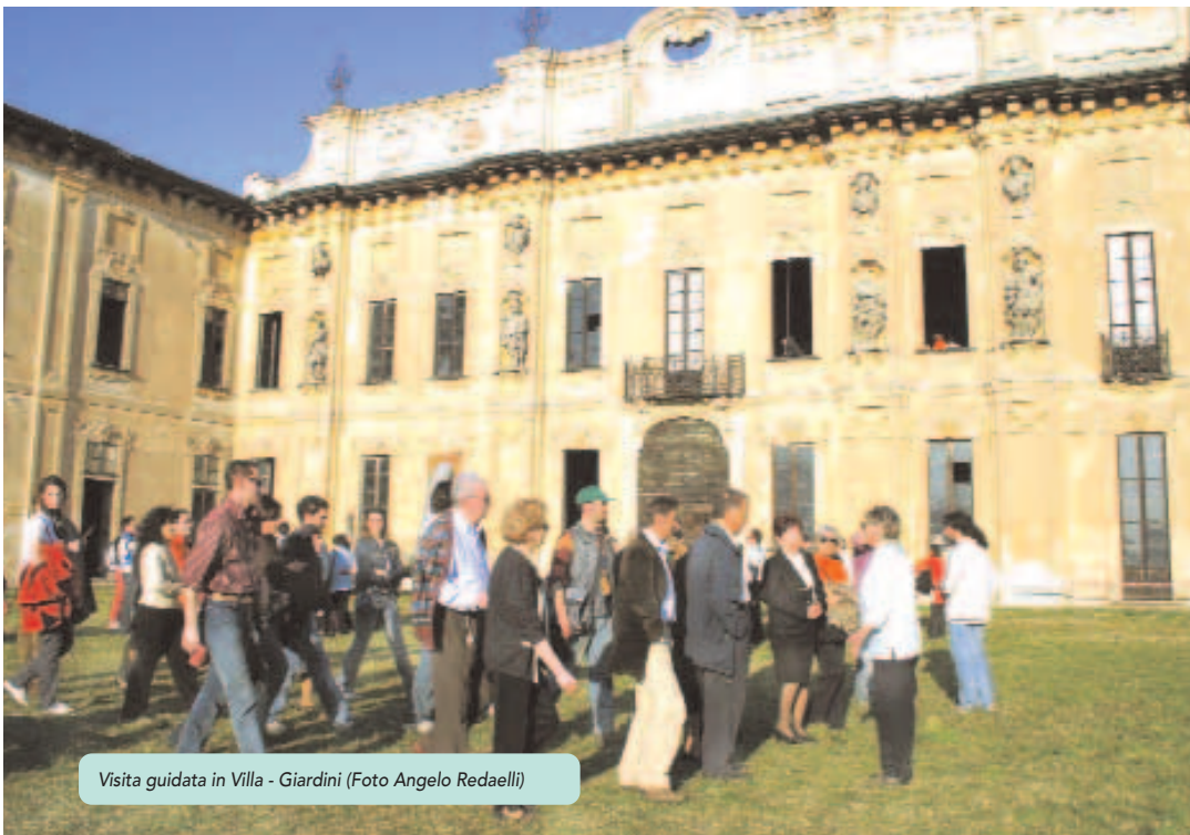
Visita guidata in Villa - Giardini